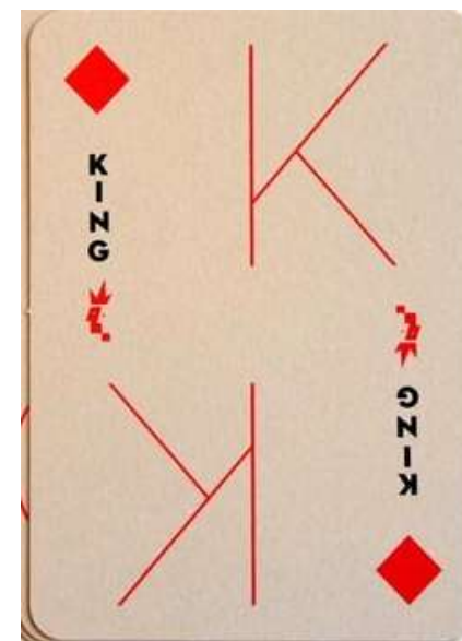
Ruder konge i spændende design!