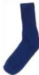
Illustration er indsat af redaktionen, dog ikke for at provokere.

Redaktionen har ikke kunnet identificere afsender, da indlægget er modtaget med snail – mail uden afsender men med poststempel Slagelse.