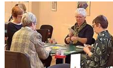
3'erne mod 2'erne

Dette spil var dagens bedste slem. Kun 3 par meldte og vandt 6 ut. Enkelte var i den dødsdømte 6♠ dobbelt, men flygtede ikke til ut. Ikke urimeligt, da man har 5-3 fit i farven. 5-0 fordeling er yderst sjælden.