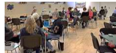
Et kik ud over hele feltet. Der er altså plads til adskilligt flere par. 20 tomme borde !

2 borde meldte Pas. 3 borde meldte 2/3 ut (7stik). Kun 2 borde fandt en delkontrakt i major. 8 stik i hjerter og 9 stik i spar.