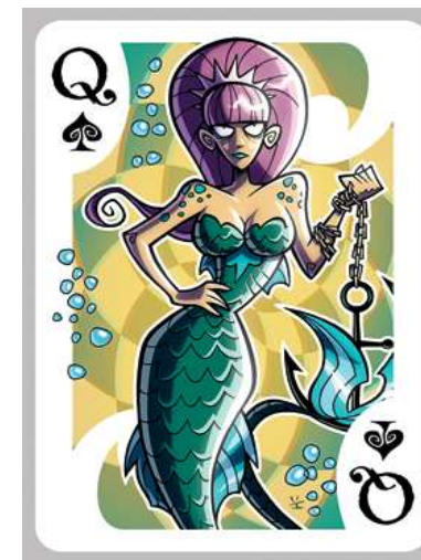
Den lille Havfrue forklædt som spar dame

Det er da klart, du undrer dig over, hvor i al verden jeg finder alle disse mærkelige kort. Det er selvfølgelig ikke nogen, jeg selv har, men jeg synes, det er sjovt at se disse anderledes udformede kort.